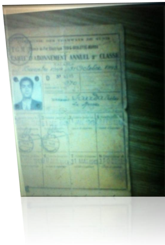
אשרת מעבר מתקופת המלחמה