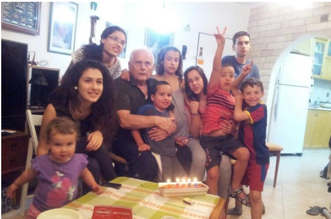
תמונה משפחתית עם נכדיי המתוקים ביום הולדתי ה-75.