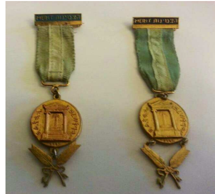
המדליות שלהן זכיתי מתוקף היותי מזכיר מצפה 6 של הבונים החופשיים