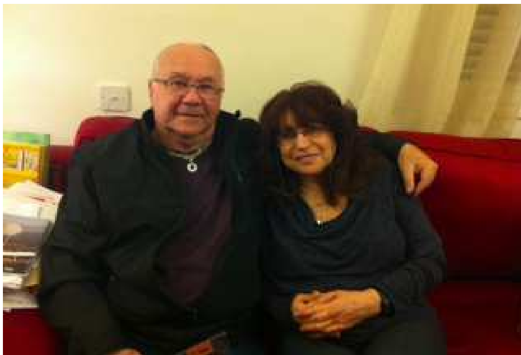
אני ובת זוגתי כיום