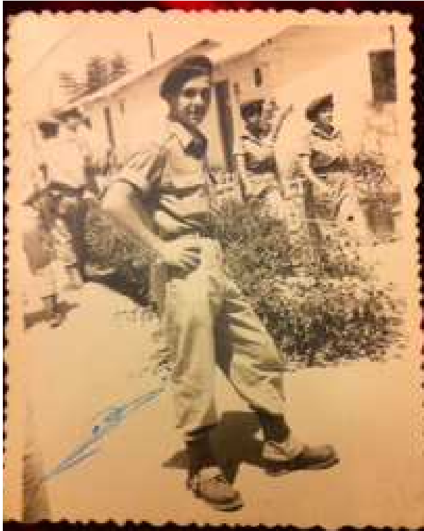
אני בתקופת השירות הצבאי